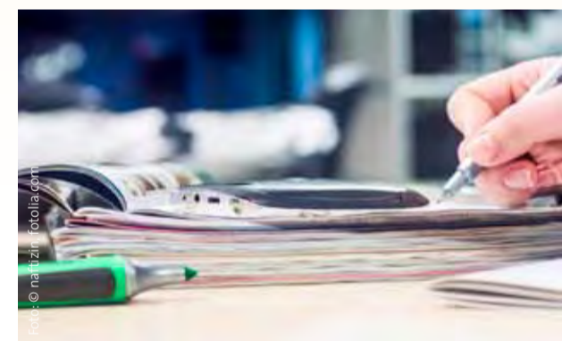
Alle hereinkommenden Informationen werden in der Verwaltung geprüft und weitergeleitet.

tengabe oder Verbandwechsel. Er sorgt dafür, dass Anträge und Formulare korrekt ausgefüllt sind. Auf seiner Agenda steht außerdem unser Fuhrpark von inzwischen 24 Dienstwagen. Damit diese stets fahrbereit sind, koordiniert er die Inspektionen und Reparaturen.