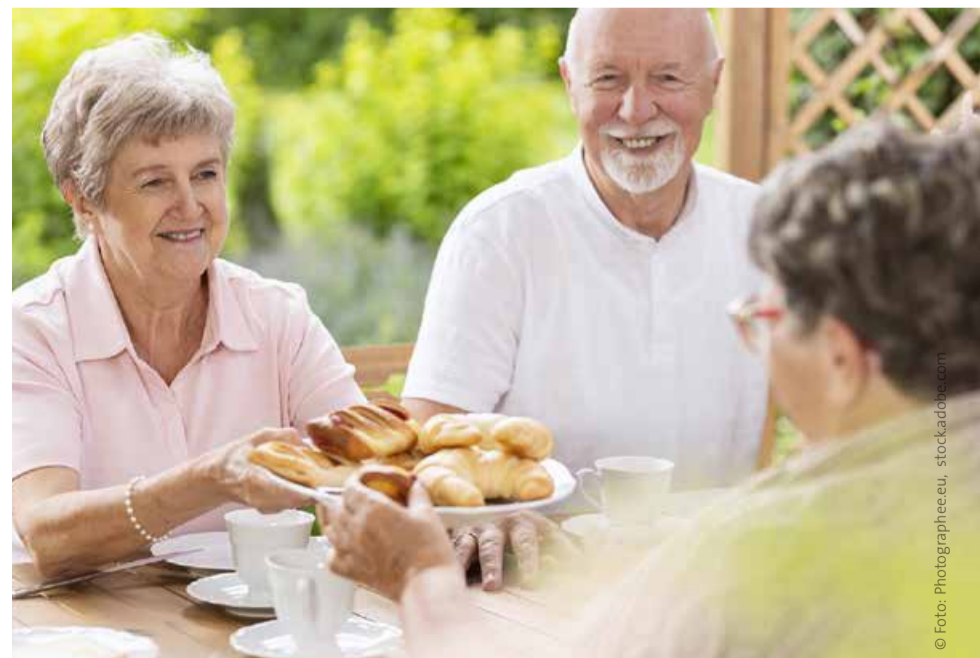
Das Frühstück wird serviert. Entspannte Momente sind wichtiger als ferne Reiseziele.