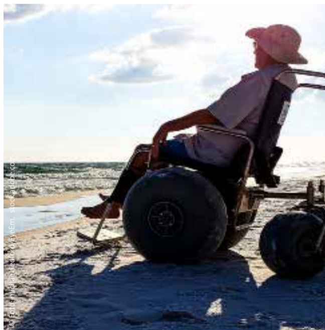
Mit einem speziellen Strandrollstuhl ganz nah ran ans Meer

Autorin: Sabine Anne Lück © Gepflegt zu Hause