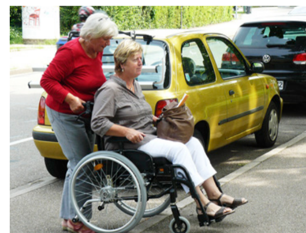
Gekannt: zwei Helferinnen beim Rollstuhltraining.

Das Team der Helfer:innen ist in jeder Hinsicht vielfältig: Junge Mütter engagieren sich ebenso wie