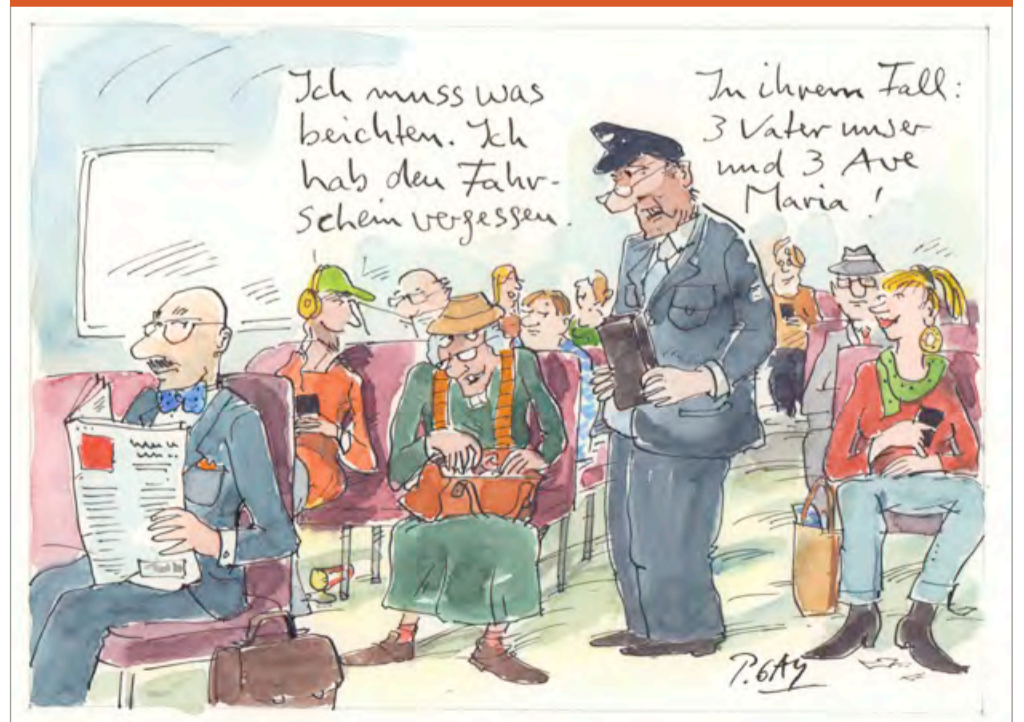
© Peter Gaymann, www.demensch.gaymann.de / Die Zeichnung stammt aus dem DEMENSCH-Kalender 2019.